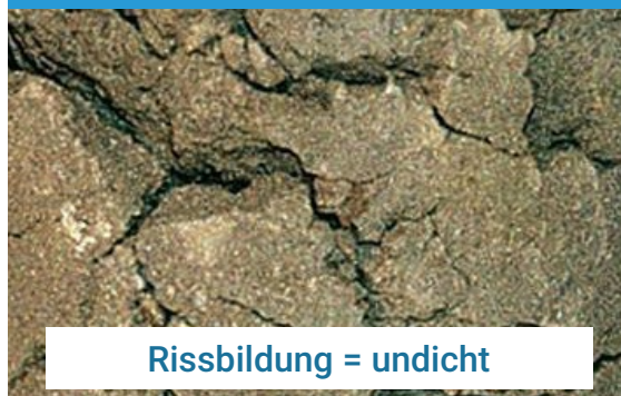
Herkömmliche Tone nach Austrocknung